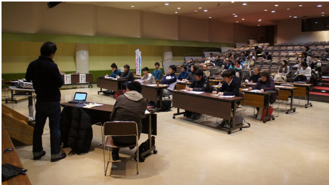
第4回地域プロデューサー養成講座