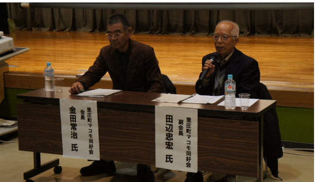
里庄町マコモ同好会のみなさんの活動報告